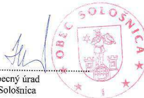
Obecný úrad Sološnica